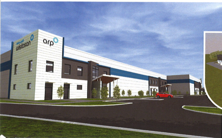
Hala w Radomiu

Przykładowe projekty inwestycyjne realizowane przez TSSE EURO-PARK WISŁOSAN